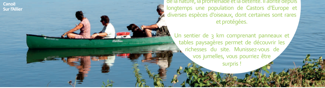
Canotiers Sur l'Allier

Un sentier de 3 km comprenant panneaux et tables paysagères permet de découvrir les richesses du site. Munissez-vous de vos jumelles, vous pourriez être surpris !