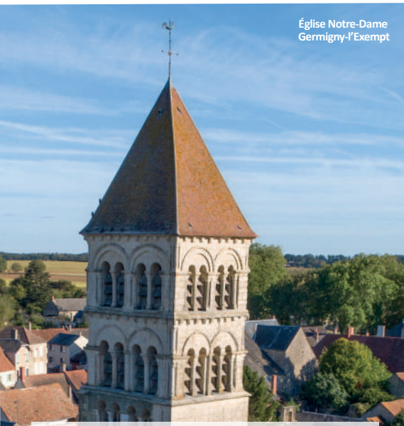
Église Notre-Dame Germigny-l'Exempt